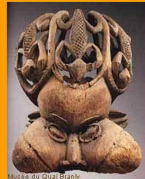
Musée du Quai Branly