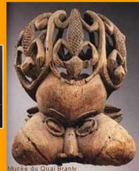
Musée du Quai Branly